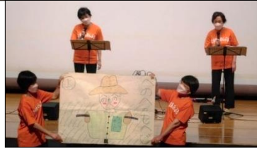
ときあんさんぶる