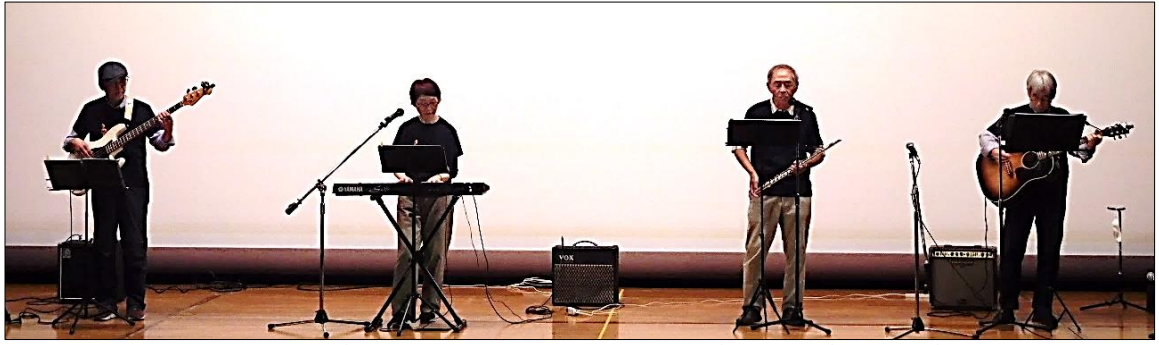
ミュージック・ステージ・バンド