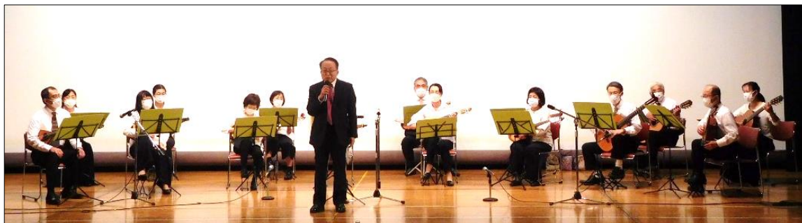
ミューズ・マンドリン・アンサンブル