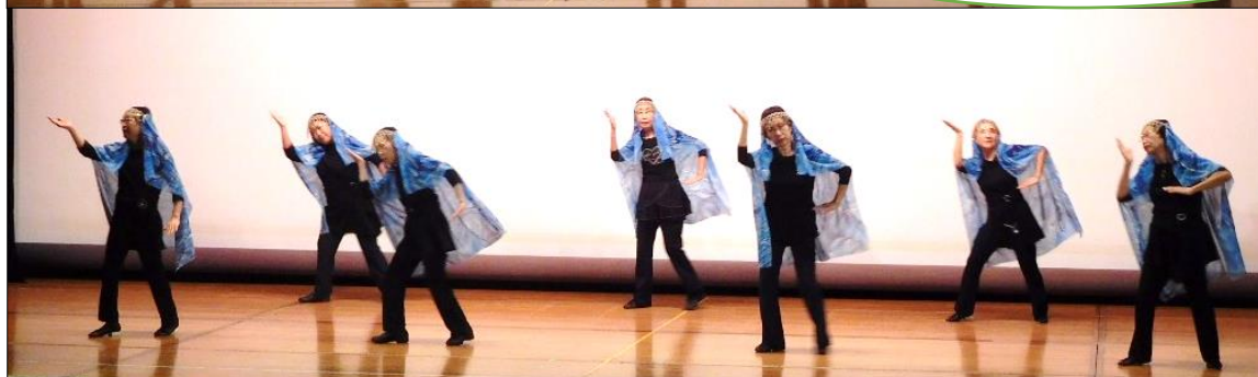
健康レクリエーションダンス「花・花」